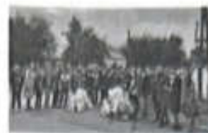
Қазан айының 24-28 аралығында «Күнделік- оқушы

айнасы» атты рейд өтті. Рейд нәтижесімен сынып жетекшілер таныстырылып, түзетулер қайта каралды.